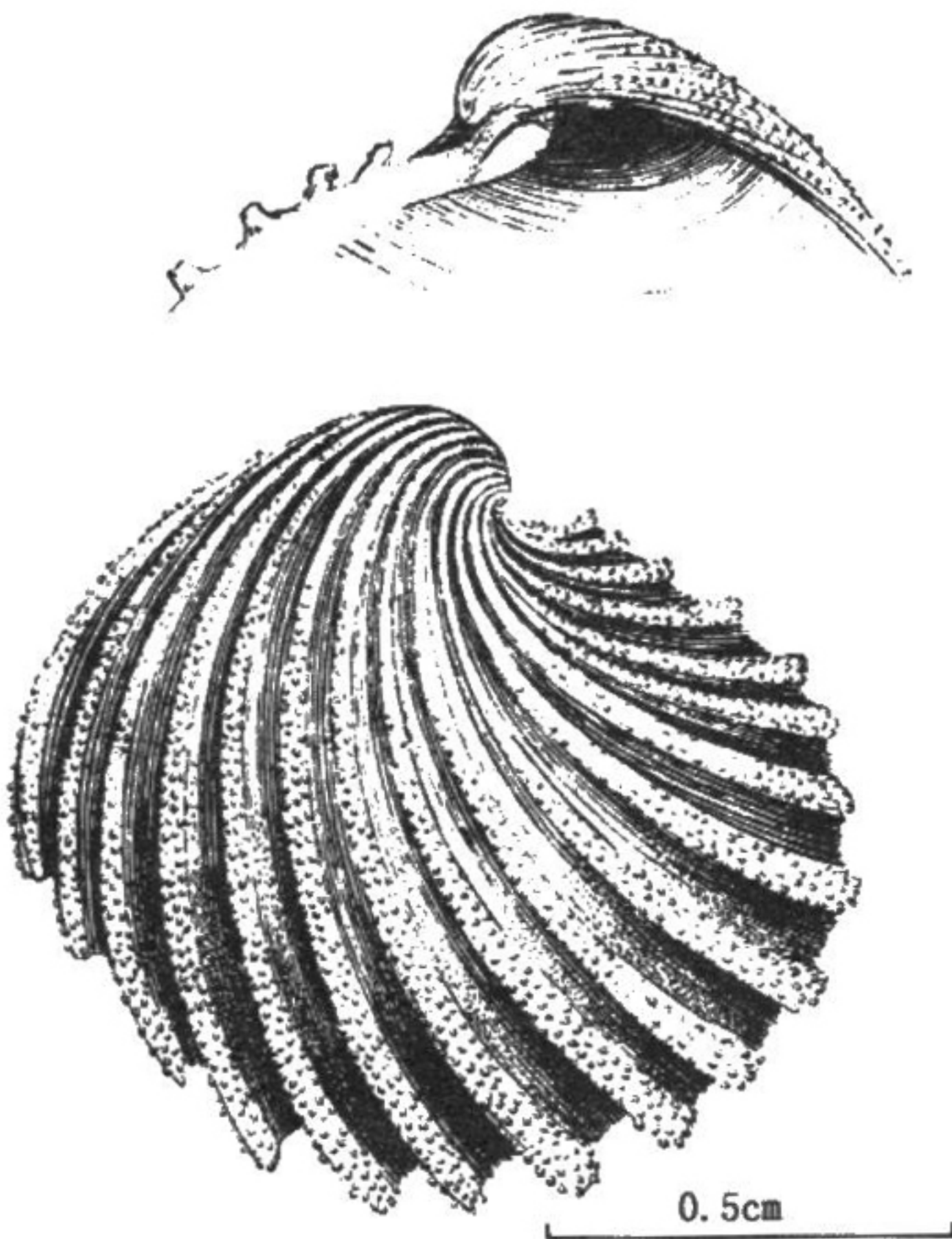
图 115 德氏旋心蛤 Verticordia (Spinosipella) deshayesiana Fischer

贝壳小型，壳质坚厚，两壳极膨胀；壳顶突出，向前向内卷曲，无小月面；壳的后端圆，壳的前端略尖；壳表有 20 条强壮的放射肋，肋间沟宽而深，颗粒状小刺遍布整个壳表面；放射肋脊上的刺较大，